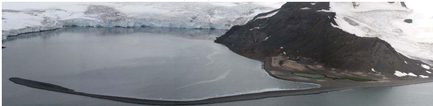
Вид Бухта Янки сверху: видна гравийная отмель, окружающая причальный пляж

Помните, что отламывание глыб от ледника, может спровоцировать опасные волны.